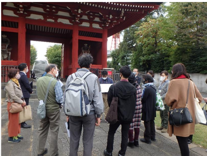
プリンス芝公園では、お花を管理するガーデナーの方からお話を伺いました。