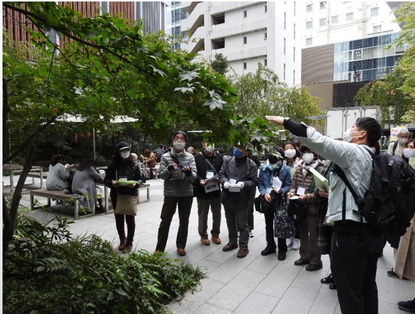
福徳の森では、管理の方法や、如何に自然に見せるかなど説明いただきました。