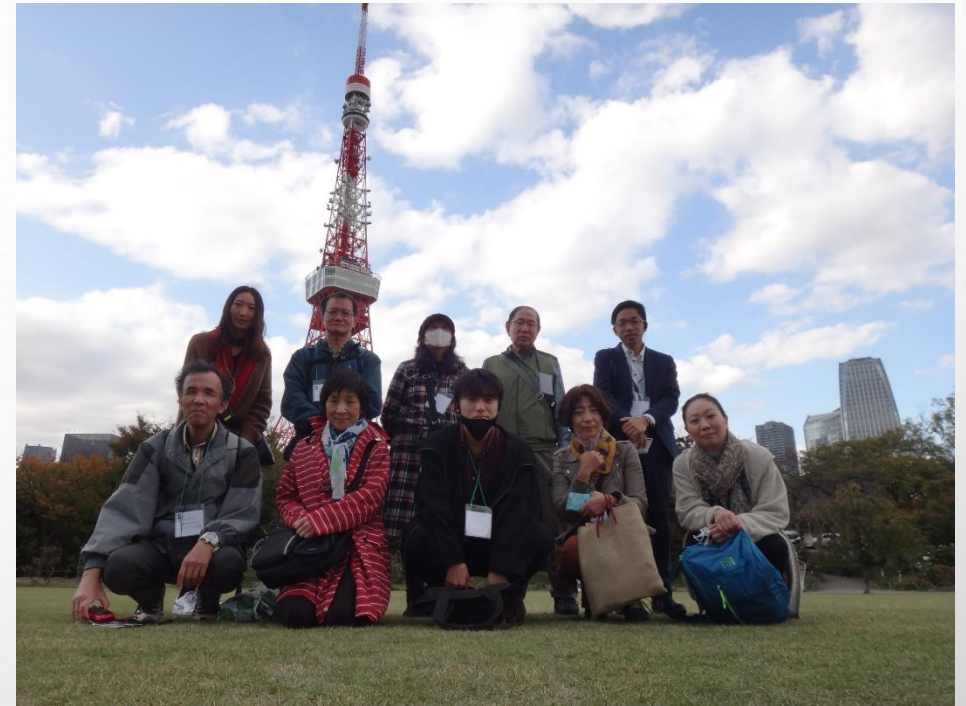
東京タワーをバックに集合写真