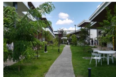
大和リース(株) ブランチ松井山手