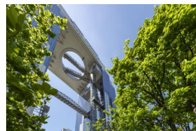
積水ハウス(株) 新・里山 希望の壁