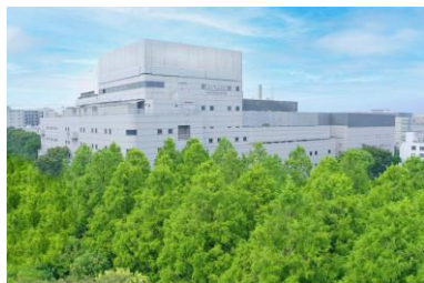
ローム(株) 「森の中の本社工場」

前回の「SEGES大阪ALL都市のオアシス見学会」を開催して以降、新たにSEGES認定緑地となった「ローム(株)本社」「IDEC(株)いずみの森」「ブランチ松井山手」について、緑地の概要、その魅力と価値づくりの取り組みをお話しいたします。