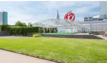
伊勢丹新宿本店本館 「アイ・ガーデン」