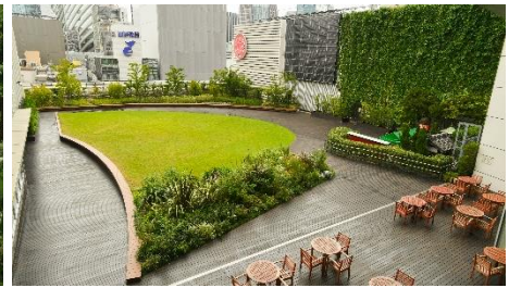
三越銀座店「銀座テラス」