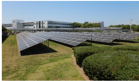
受配電システム製作所