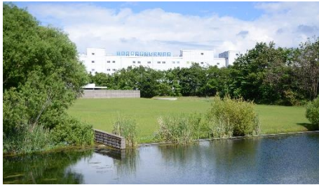
黒部事業所 (YKKセンターパーク)