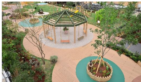
グランツリー武蔵小杉 「ぐらんぐりんガーデン」