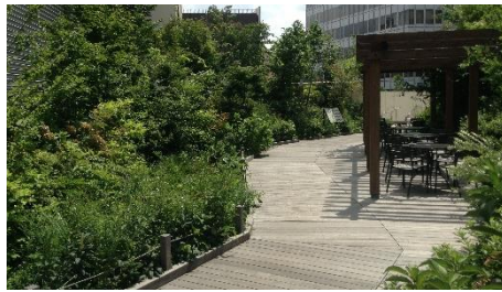
中野マルイ 「四季の庭・水辺の庭」