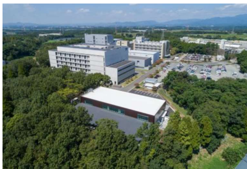
明治グループ自然保全区 くまもと こもれびの森®