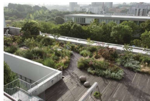
(株)グリーン・ワイズ本社事業所